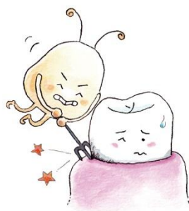
は 歯と歯ぐきの間