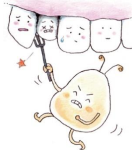
は 歯並びがでこぼこ しているところ