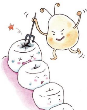
は おく歯のかみあわせ