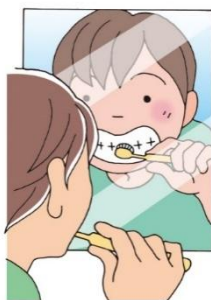
かがみをみながら