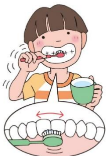
こちょこちょみがき (一本ずつ)