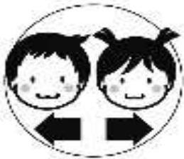
男女別 に行います