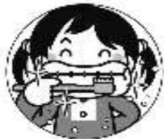
歯みがきを 忘れずにしましょう