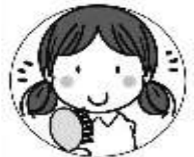
髪型に 気を付けましょう