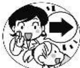
先生の指示に 従いましょう