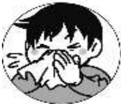
鼻をかんで おきましょう