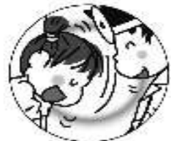
しっかり あいさつしましょう