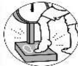
体重計にはそっと 乗りましょう