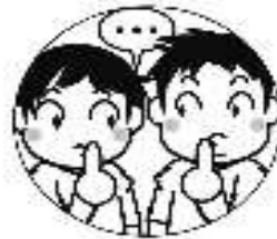
待ち時間は 静かにしましょう